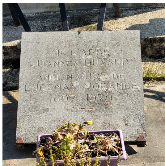
La tombe du père Dussud à Saint-Clément-les-Places